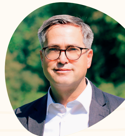
Ihr Konrad Menz Bürgermeister der Stadt Blaustein