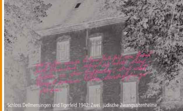
Schloss Dellmensingen und Tigerfeld 1942: Zwei jüdische Zwangsaltenheime