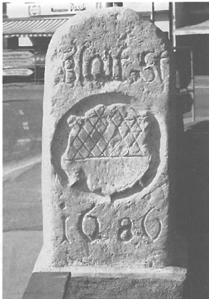
Geleitstein aus ulmischer Sicht (Kopie aus dem Jahr 2002)

Wenn wir uns heutzutage ins Auto setzen, um von Ulm nach Stuttgart, Nürnberg oder Reutlingen zu fahren, so können uns allenfalls eisglatte Straßen oder Staus dazu veranlassen, über die beste und sicherste Route nachzudenken. Natürlich denken wir ein wenig auch über die Unfallgefahr im Straßenverkehr nach. Aber wirkliche Gedanken über einen Fehlschlag unserer Reise kommen uns kaum in den Sinn.