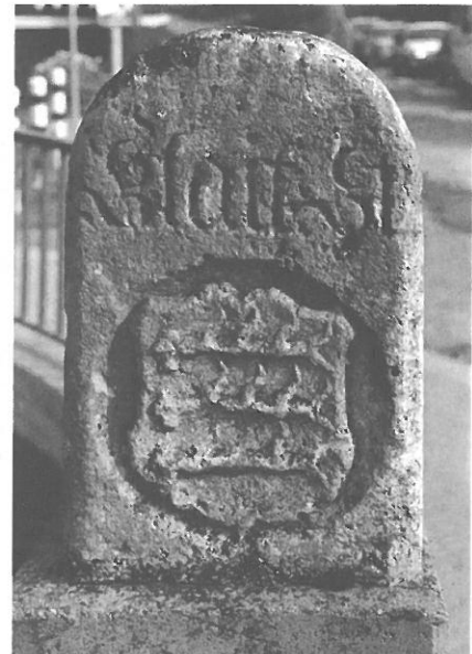
Geleitstein aus württembergischer Sicht (Original von 1686)

Vor gut 500 Jahren sah dies noch völlig anders aus. Wo wir in Stunden rechnen, mussten die Reisenden früher Tage einplanen. Das Fortbewegungsmittel – wenn man überhaupt ein solches hatte – war unbequem, die Straßen waren staubig, immer wieder stand man an Zollschranken und hatte seine Abgaben zu entrichten. Und nicht zuletzt sorgten Räuber und Wegelagerer für Unsicherheit. Leib, Leben und Habe waren bedroht.