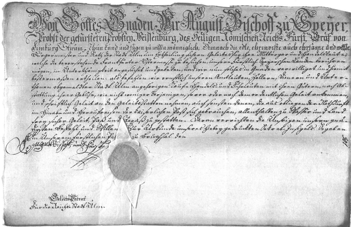
Geleitbrief (Original: Stadtarchiv Ulm, A [2812])

Reisende hatten sich zu einem bestimmten Zeitpunkt an einem bestimmten Ort vor der Stadt zu sammeln und mussten für ihren Schutz ein Geleitgeld entrichten. Der Geleitbrief besiegelte den Schutzvertrag und garantierte im Verlustfall die Wiedergutmachung des erlittenen Schadens.